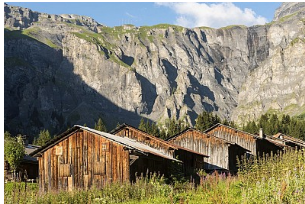
Refuge des Fonts